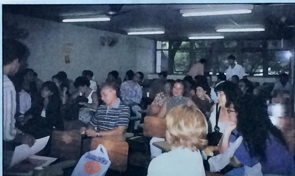
Nos cursos de treinamentos a Monteverde organiza palestras sobre saúde e segurança