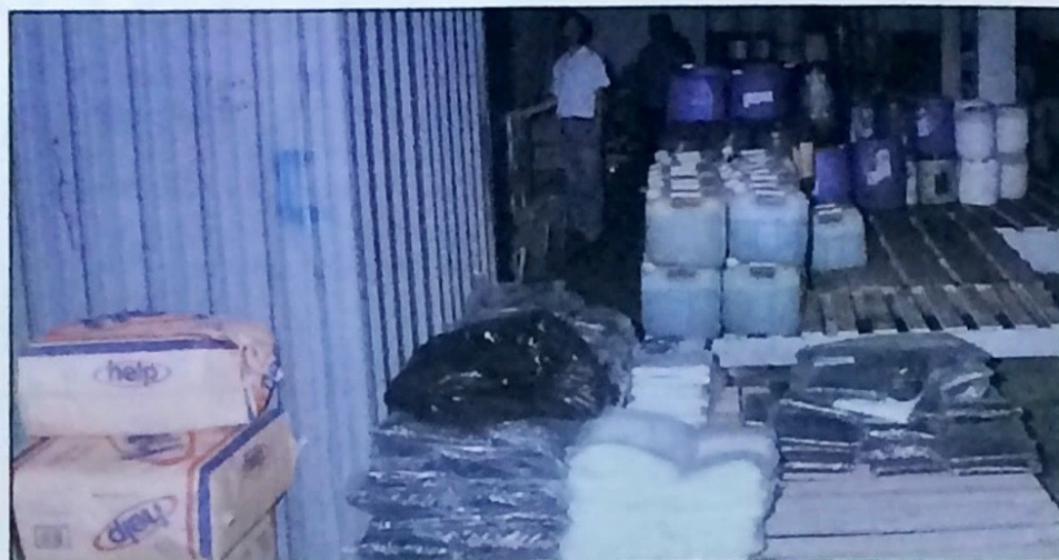
Os produtos químicos devem ser manuseados com os equipamentos de segurança

Uma pele sadia é absolutamente capaz de resistir aos fungos que causam micoses. Essas doenças não estão necessariamente ligadas a falta de higiene da pessoa, mas sim de vários outros fatores. Nestas situações uma ida ao médico é fundamental para acabar com as micoses.