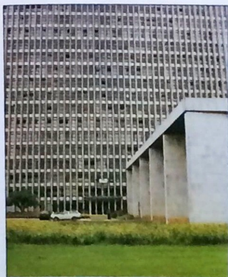
Palácio do Buriti e seu Anexo

Localizados na Praça Municipal, o Palácio do Buriti e o seu Anexo funcionam como sede administrativa do Distrito Federal, abrigando o gabinete do governador, secretarias e vários órgãos auxiliares. Projeto de Oscar Niemeyer, o Palácio do Buriti e seu Anexo foram inaugurados em 25 de agosto de 1969.