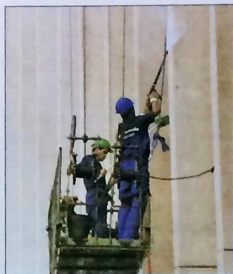
Empregados limpam a fachada do Anexo

qualidade e a eficiência dos serviços de limpeza e conservação (foto 2) executados pela Monteverde ressaltam ainda mais as formas e a suntuosidade dos prédios. Pelo trabalho realizado, a Monteverde tem recebido seguidos elogios pela forma como a sua equipe de funcionários desempenha suas tarefas, destacando-se a recente lavagem da fachada do Anexo do Buriti (foto 3) feita em tempo recorde e que doravante será realizada pelo menos uma vez por ano.