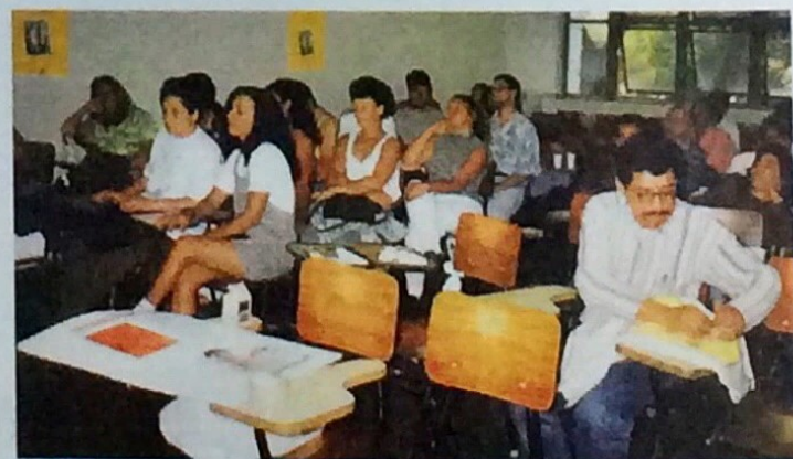
Monteverde mantém mão-de-obra treinada