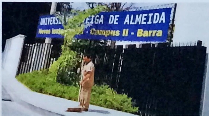
Universidade Veiga de Almeida é cliente Monteverde

Superadas as dificuldades, o empresário decide que era hora de ampliar os horizontes. Em 1942, cria a Monteverde Engenharia Comércio e Indústria S/A, começando a atuar paralelamente no ramo da construção civil.