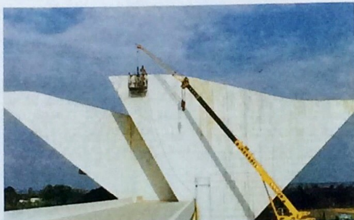
Limpeza da fachada do Panteão da Pátria em Brasília