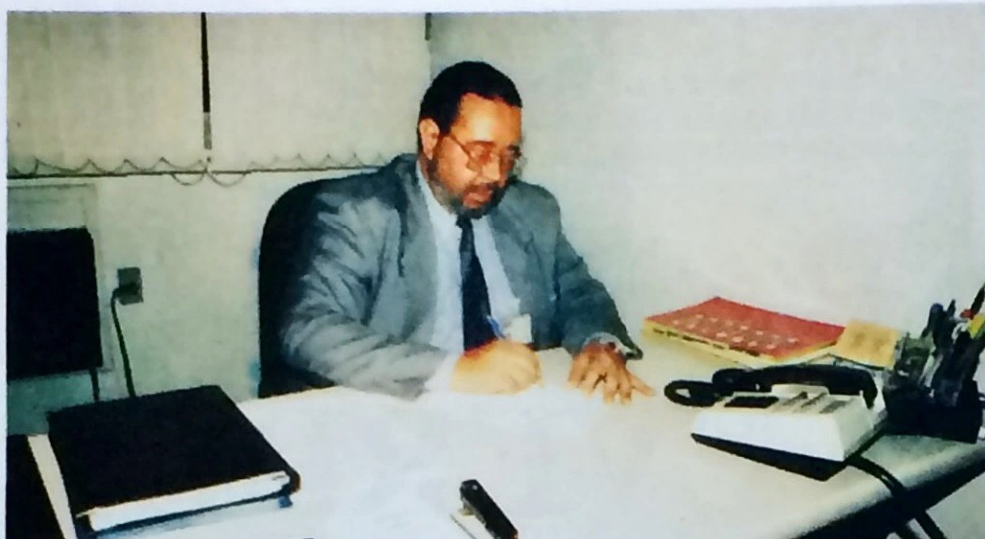
Marins: A qualidade total é fundamental

A cada mês, uma nova edição. A cada edição, novas notícias, vamos criar a coluna “Falando a nossa linguagem”.