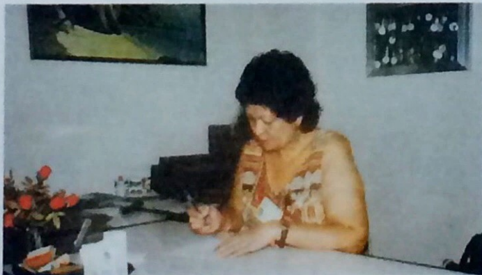
Na Monteverde, o trabalho da mulher é valorizado