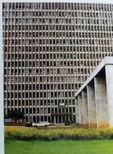
Palácio do Buriti e seu Anexo